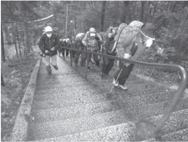
太郎坊宮まで急こう配 742 段の苦行

雨で眺望に恵まれなかったが、変化に富んだコースに恵まれ、楽しい一日を過ごす事が出来た。