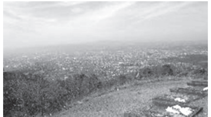
高円山の火床からの眺め